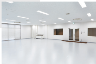
レジデンスルーム (約 138 m 2 )