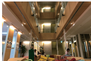
ココテラス湘南ビル共用部分 (一例)