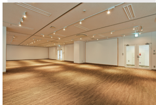
展示ルーム (約 200 m 2 )