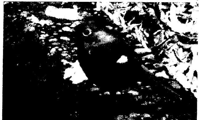
ジョウビタキ(メス)