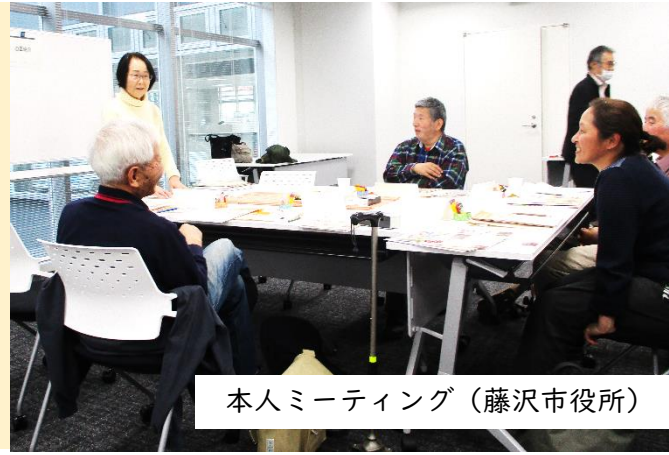
本人ミーティング（藤沢市役所）