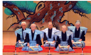
謡曲部会が神歌「翁」を謡い落成を祝った。