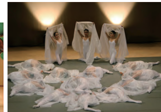
賛助出演の乃羽バレエ団 いつもながら、圧巻の演技