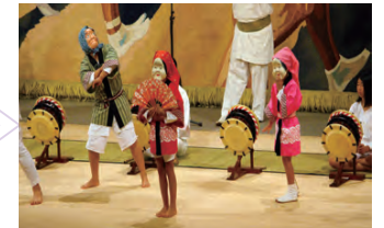
祭り囃子では神楽が大受け！ ちびっこが演ずるオカメヒョットコ！