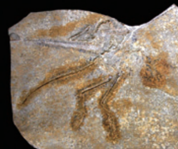
↑始祖鳥化石【ドイツ アイヒシュテット】（レプリカ） ←緑柱石（エメラルド） 【コロンビア】（寺島晴夫氏所蔵）