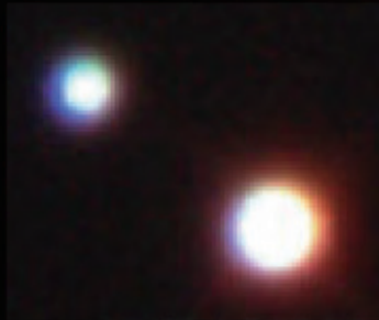
アルビレオ（国立天文台）