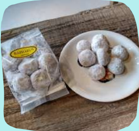
鎌倉ラファエル会