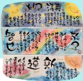
筆文字デザイン空(くう)★