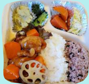
農家レストランいぶき