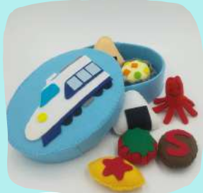
フェルトのおもちゃ屋「まるま」