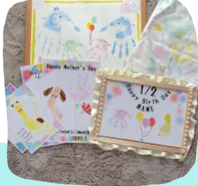
赤ちゃんから楽しめる手形アート★