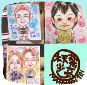
木天蓼亭またたびい★