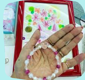
This is me.